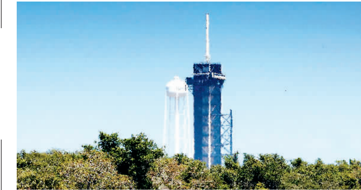
8日，美国佛罗里达州肯尼迪航天中心，39A发射台仍然是空的，倒计时时钟显示关闭。