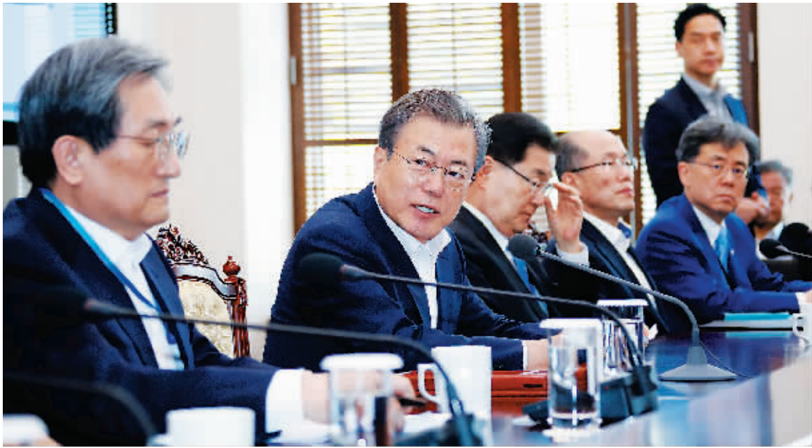
15日,在韩国首尔青瓦台,韩国总统文在寅(左二)在会议上发言。

韩国总统文在寅15日下午主持召开青瓦台首席秘书和助理会议时说,准备并推进韩朝领导人再次会晤的时机已到,希望双方能不拘时间、地点,坐在一起进行具体的、实质性的讨论。