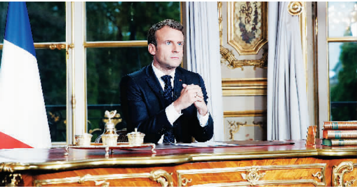
16日,在法国巴黎,法国总统马克龙发表电视讲话。

法国总统马克龙16日晚针对巴黎圣母院严重火灾发表简短电视讲话,表示希望在五年内重建巴黎圣母院。马克龙说,巴黎圣母院大火令法国人民和全世界甚为痛心。“那个夜晚,我们在巴黎一起见证了团结行动、克服困难的能力。”