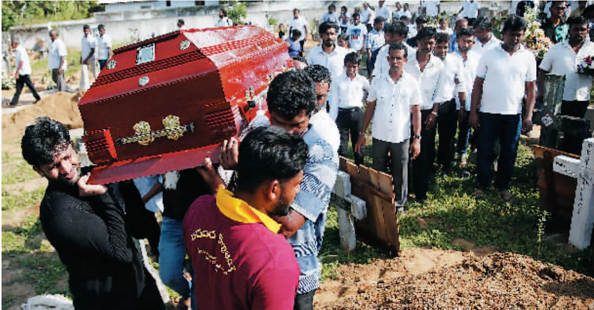
23日,在斯里兰卡尼甘布,人们参加一名爆炸袭击遇难者的葬礼。

23日为斯里兰卡全国哀悼日,斯里兰卡政府和许多私营机构当天降半旗,向21日连环爆炸袭击中的遇难者致哀。当天,斯里兰卡进入全国紧急状态。斯总统府、总理府及中央和地方政府机关均降半旗,向遇难者致哀。科伦坡市区遭受的香格里拉大酒店和一些公司也降半旗志哀。斯里兰卡警方24日说,该国21日发生的连环爆炸袭击已经造成359人身亡、超过500人受伤。