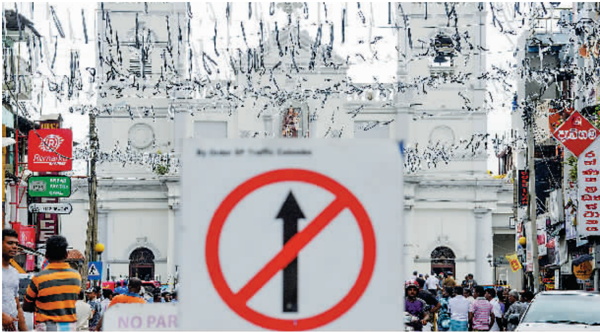
29日,斯里兰卡科伦坡,士兵在圣安东尼大教堂外站岗。

当地时间29日,斯里兰卡安全官员警告称,情报机构获得信息,当地极端组织NTJ成员准备发起新一轮袭击,作案人员可能穿军伪装掩护载有炸弹的厢型车。执法部门推测,极端分子可能将通过女性自杀式袭击者发动袭击。