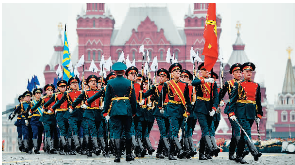
9日,俄罗斯卫国战争胜利74周年阅兵式在莫斯科红场举行。

当地时间9日上午,俄罗斯在莫斯科红场举行阅兵式,以纪念卫国战争胜利74周年,同时对外展示俄罗斯的军事实力。