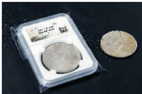
民国九年袁像银币(左:真,右:伪)

几乎每个人的孩提时代,都会有储藏钱币的经历,成色干净的钱币会收藏起来,花色不同的更是会特别收藏起来。实际上,作为市场中用来交换商品的载体,钱币自古以来就是收藏圈的宠儿,在一枚枚斑驳的钱币之上,收藏者感受到的是时代的印记和变迁。那么,对于新手藏家来说钱币收藏又有哪些技巧呢?