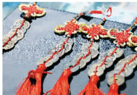
小五帝钱(左:伪,右:真)