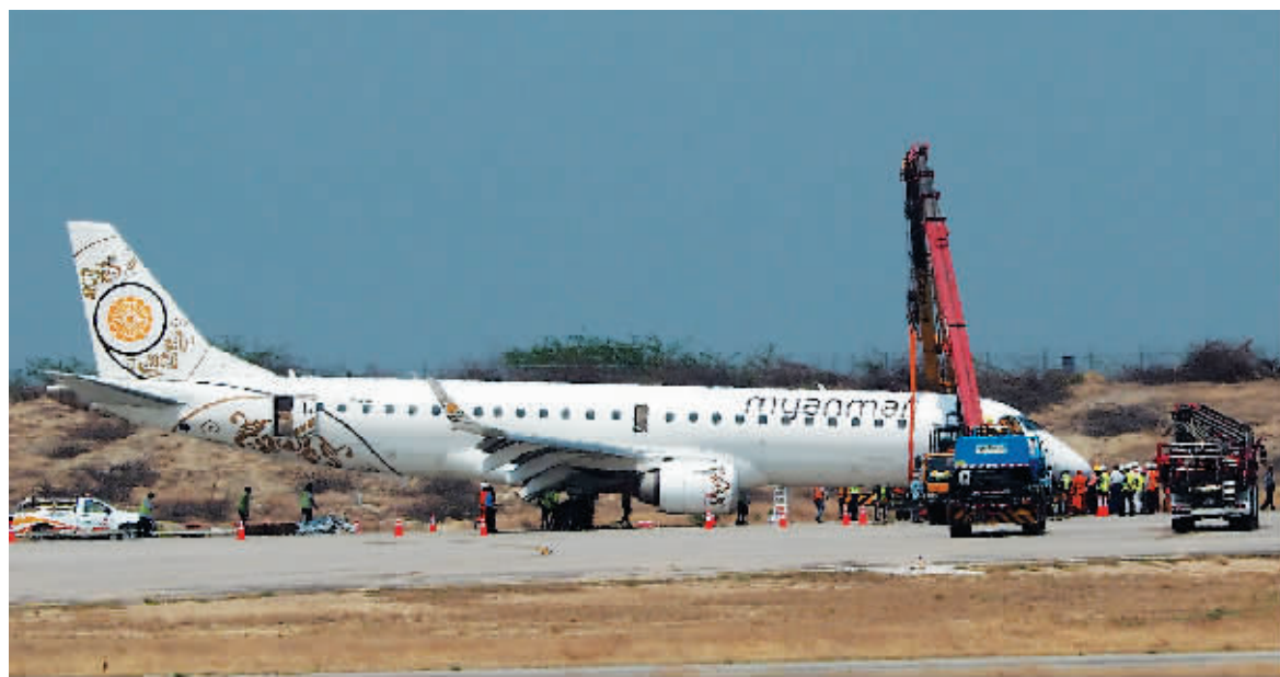
12日,缅甸国家航空公司一架从仰光飞往曼德勒的航班,因前起落架故障,以腹部着陆方式在曼德勒国际机场迫降。

缅甸当地时间12日7时15分,一架从仰光飞往曼德勒的UB103航班执飞飞机,在缅甸曼德勒国际机场降落过程中,出现前起落架无法打开的意外状况,迫降过程中机头触地。幸运的是,机上共82名乘客,无人员伤亡。