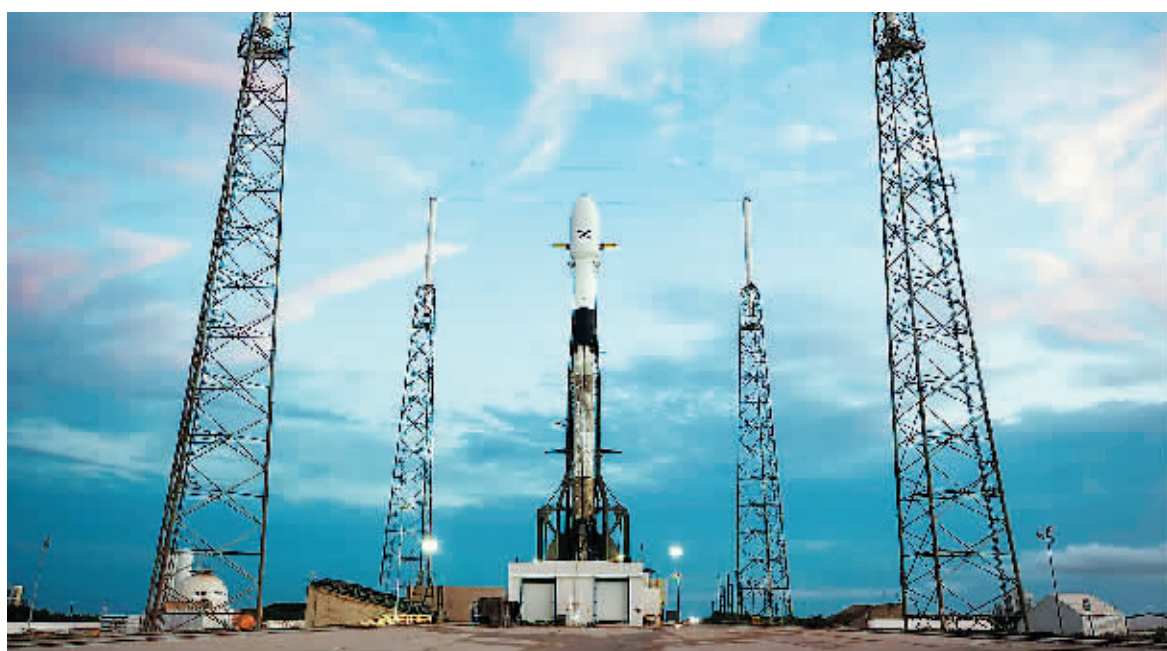
15日,SpaceX推迟了原定当日发射首颗Starlink互联网卫星的计划,理由是佛罗里达州发射场风力过大。

据路透社报道,SpaceX因发射场的风力过大,推迟了原定美国当地时间周三发射一枚Falcon 9火箭的计划,该火箭携带60颗为Starlink互联网服务的卫星。SpaceX表示,将于周四晚10点30分重新尝试发射该火箭,发射的60颗卫星将被置于低地球轨道,完成Starlink计划的初始阶段工作。