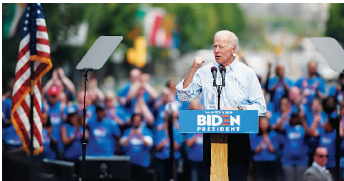
18日,美国前副总统、民主党人乔·拜登在美国宾夕法尼亚州费城举行的集会上发表演讲。

美国前副总统、民主党人乔·拜登18日在宾夕法尼亚州费城举行集会,正式启动总统竞选活动。拜登当天以“团结”为主题发表其竞选演说,谈及医保、基建、教育、气候变化等话题。他强调自己跨党派寻求共识的能力和履历,并表达对华盛顿政治圈风气及现任总统特朗普执政风格的不满。