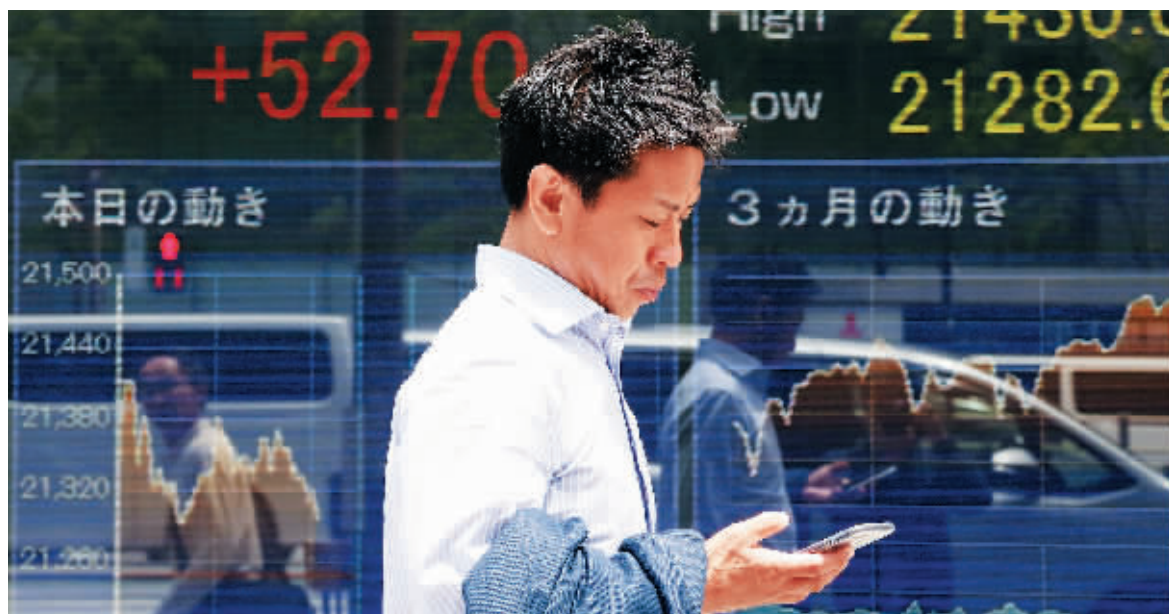
20日,在日本东京,一名男子经过一块显示股指信息的电子显示屏。

在去年四季度摆脱衰退阴霾后,日本经济意外没有“倒春寒”,反而进一步增长。20日,日本内阁府公布数据显示,日本一季度实际GDP年化季环比初值2.1%,预期-0.2%,前值由1.9%下修至1.6%。