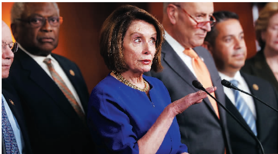
22日,美国众议院议长佩洛西、参议院民主党领袖舒默等人对媒体发表讲话。

由于不满国会民主党对其进行调查,美国总统特朗普22日中断与民主党高层在白宫的会晤,双方原定就一项基建计划进行磋商。双方当天只进行了简短会晤。特朗普在随后召开的临时记者会上说,如果民主党想继续就基建议题展开对话,就必须停止对他进行调查。