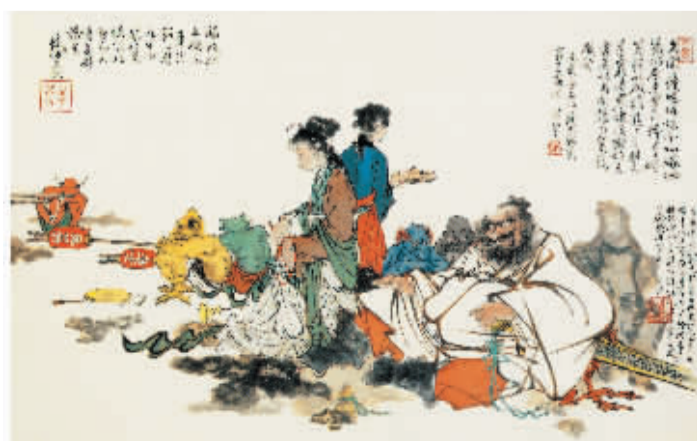
《钟馗嫁妹》33cm×43cm(纸本设色)1986年