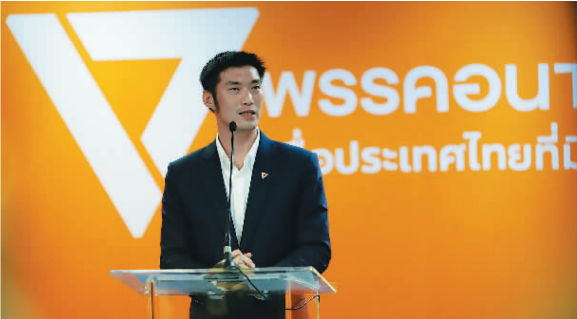
4日,在泰国首都曼谷,新未来党党首塔纳通在为泰党等7个党派宣布支持他竞选总理后出席新闻发布会。

泰国国会于5日投票选举新总理。新未来党发言人4日表示,包括为泰党在内的7党联盟已决定共同推举新未来党领袖塔纳通角逐总理一职。这意味着,泰国新一任总理将在塔纳通和现总理巴育之中产生。支持现政权的人民国家力量党此前已推举巴育为新任总理候选人。