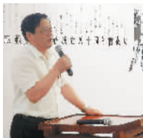
中国美协分党组书记徐里