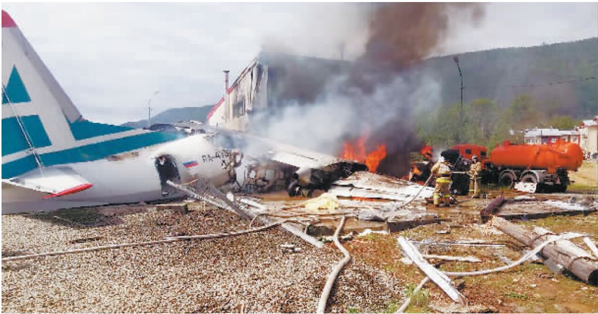
6月27日，在俄罗斯东部布里亚特共和国的下安加尔斯克市，消防员在下安加尔斯克机场灭火。

据今日俄罗斯通讯社27日报道，俄罗斯一架安-24客机当日清晨在位于俄东部的布里亚特共和国境内一机场紧急迫降，事故造成两名飞行员遇难，7人受伤。