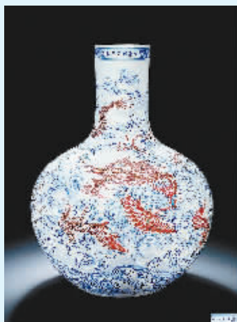
清雍正御制青花釉里红云海腾龙大天球瓶 成交价:1.472亿元