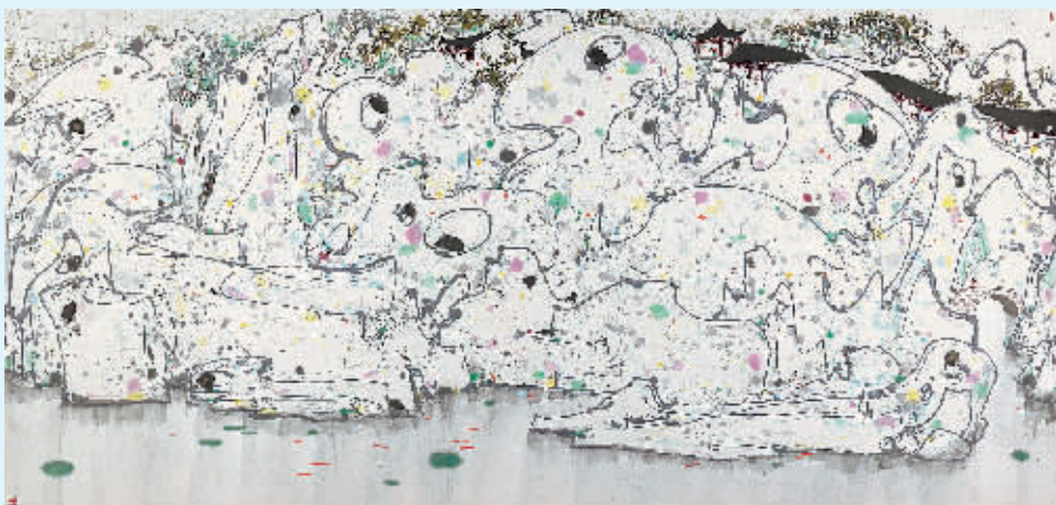
吴冠中《狮子林》成交价:1.4375亿元

在内地春拍接近尾声之际,市场的走势逐渐清晰。从目前的成交情况来看,“提质减量”已经成为拍卖行业的一大共识。值得一提的是,今年春拍亿元拍品只有2件,同比2018年春拍的6件缩水明显。然而,市场整体成交额却与以往基本持平。有业内人士分析,拍卖市场正处于结构性转型阶段,亿元拍品锐减,但中高价位拍品逐步崛起并不断筑底,市场的向好面在扩大。