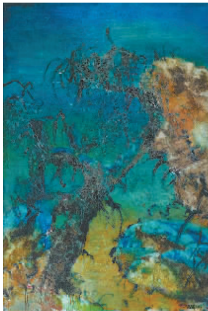
周春芽《石头系列——与石头联接的树》 成交价:3252.5万港元

值得一提的是：“离心力”晚拍是佳士得香港本季全新策划的拍卖专场，汇聚以中国艺术家为主的来自生于1969-1989年间的16位当代艺术家，最终总成交5217.75万港元，成交率达89%，让业界看到了中国当代艺术的未