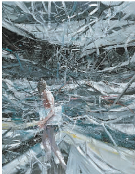
贾蔼力《疯景》 成交价:1812.5万港元

来市场潜力。其中，领衔拍品为贾蔼力的《疯景》，以1812.5万港元成交，刷新个人拍卖纪录。同场，黄宇兴在二级市场上尺寸最大的作品《沉浮》以225万港元成交，刷新个人纪录。梁远苇大尺幅作品《无题2013.17》以516.5万港元成交，超此前纪录一倍之多。