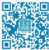
北京商报官方微信