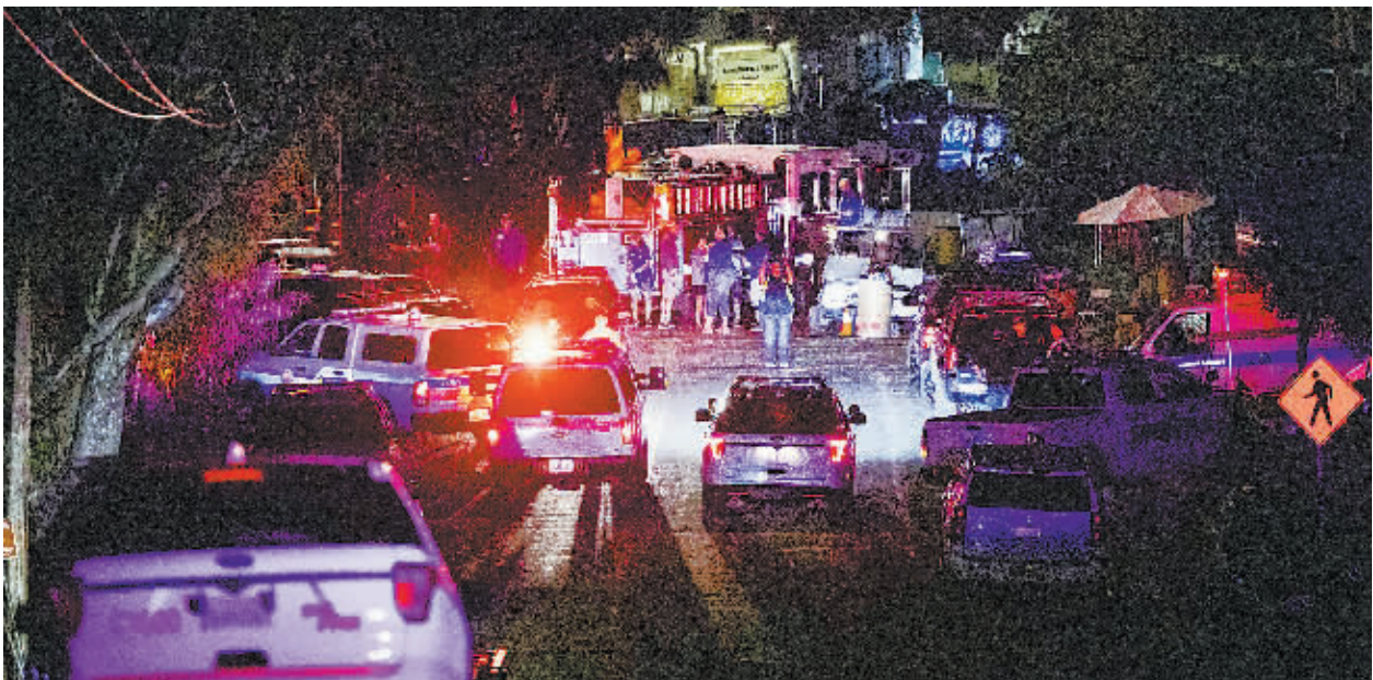
28日，在美国吉尔罗伊市，警车抵达枪击案现场。

美国加利福尼亚州旧金山湾区吉尔罗伊市28日发生一起严重枪击案。警方当晚证实，枪击案共造成包括枪手在内4人死亡、15人受伤。