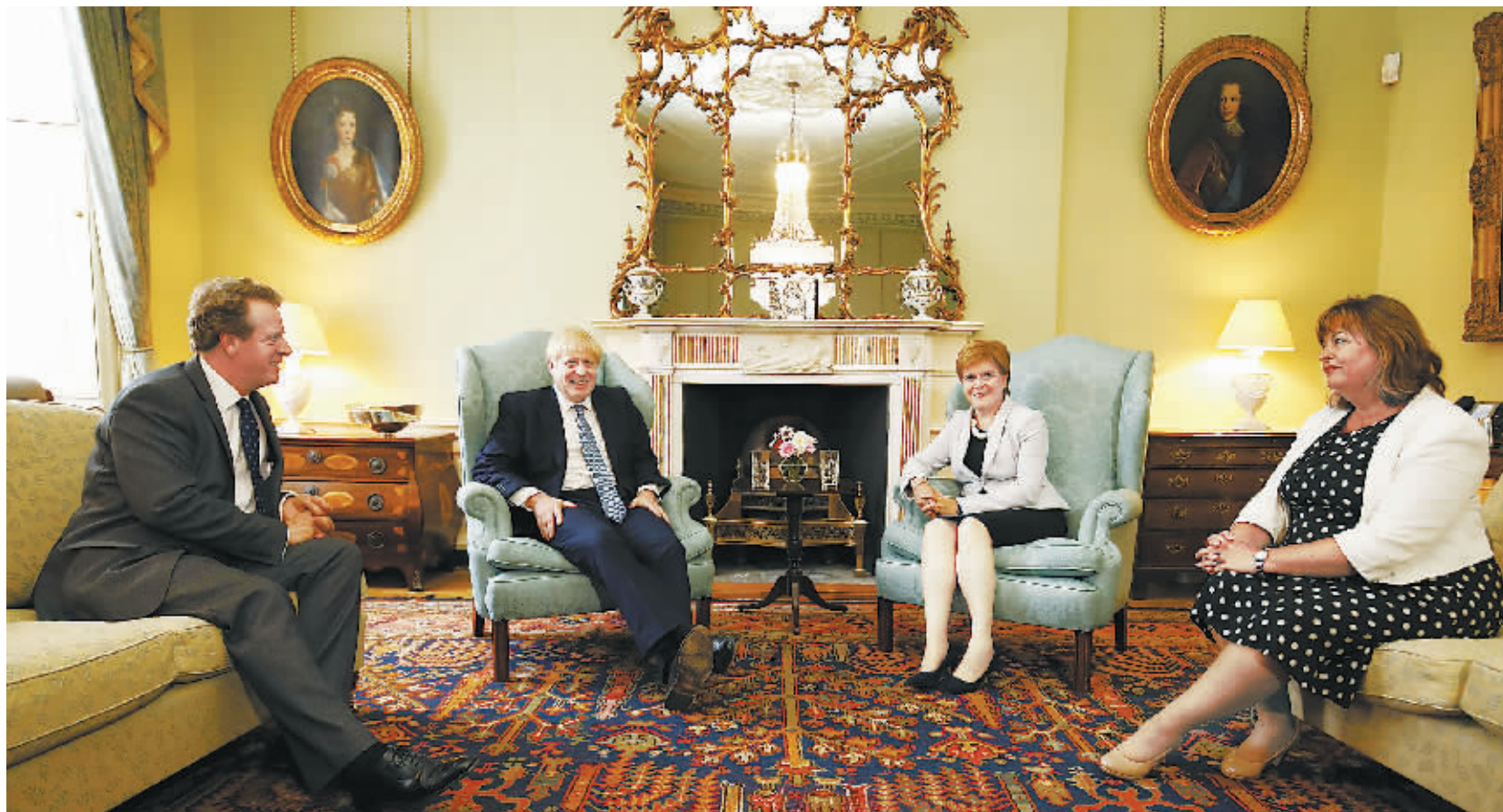
29日,英国首相鲍里斯·约翰逊与苏格兰首席大臣尼古拉·斯特金会晤