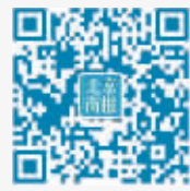
北京商报官方微信