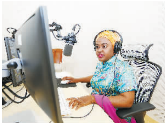
四达时代在非洲30多个国家注册成立公司并开展数字电视运营