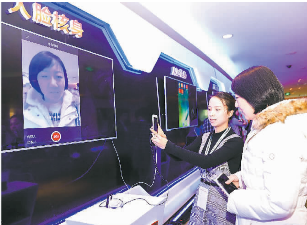
客户体验中国平安人脸核身技术

从成立之初便埋下的科技基因种子,成为中国平安科技创新永不止步的源泉;30年的创新裂变成为中国平安科技驱动型企业强有力的“后盾”。目前,中国平安的科技创新已不单单成就自己,也实现了反哺金融行业、回馈社会的功效。北京商报记者近日走进该公司,实地探访科技转型“排头兵”的“从1到N”科技创新裂变的途径。