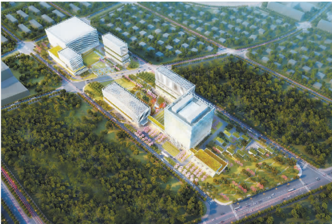
即将投入使用的北京银行顺义科技研发中心

宏观经济周期、贸易摩擦、金融业开放、利率市场化进程加快等因素，将传统商业银行带离利润高速增长的“舒适区”。面对金融科技的高速发展，客户需求多变、产品迭代迅速成为新常态，商业银行不可避免地走进变革洪流。在中国银行业协会城商行工作委员会发布的《城市商业银行发展报告(2018)》中，北京银行成为城商行中为数不多的运用了大数据、人工智能、云计算、生物识别、区块链五大金融科技技术的大满贯得主。今年5月，北京银行金融科技子公司正式成立，成为城商行首家。对于北京银行来说，金融科技的探路历程遇到了哪些艰辛？对于未来商业银行科技革新又有着哪些思考？