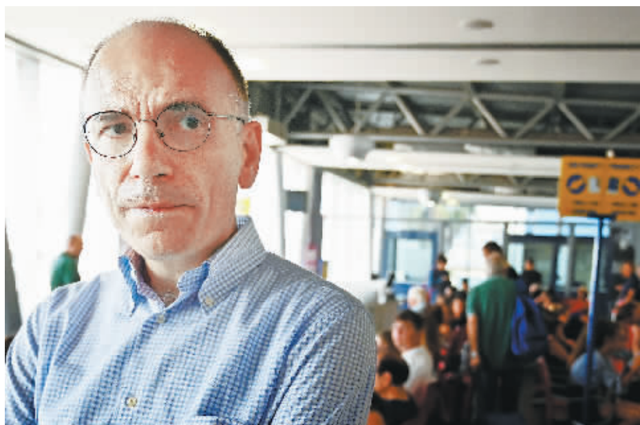
11日,意大利前总理莱塔在拉贾齐亚机场接受采访。