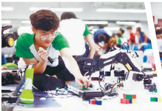
制造大挑战项目的大学生组正在紧张地进行比赛

有着机器人界“奥林匹克”之称的“世界机器人大赛”正在火热进行中,吸引了多个国家和地区专业人士及爱好者的广泛参与。值得一提的是,大赛还专门设置了青少年机器人设计大赛,为各国热爱机器人的孩子们提供充分展示自己的平台。