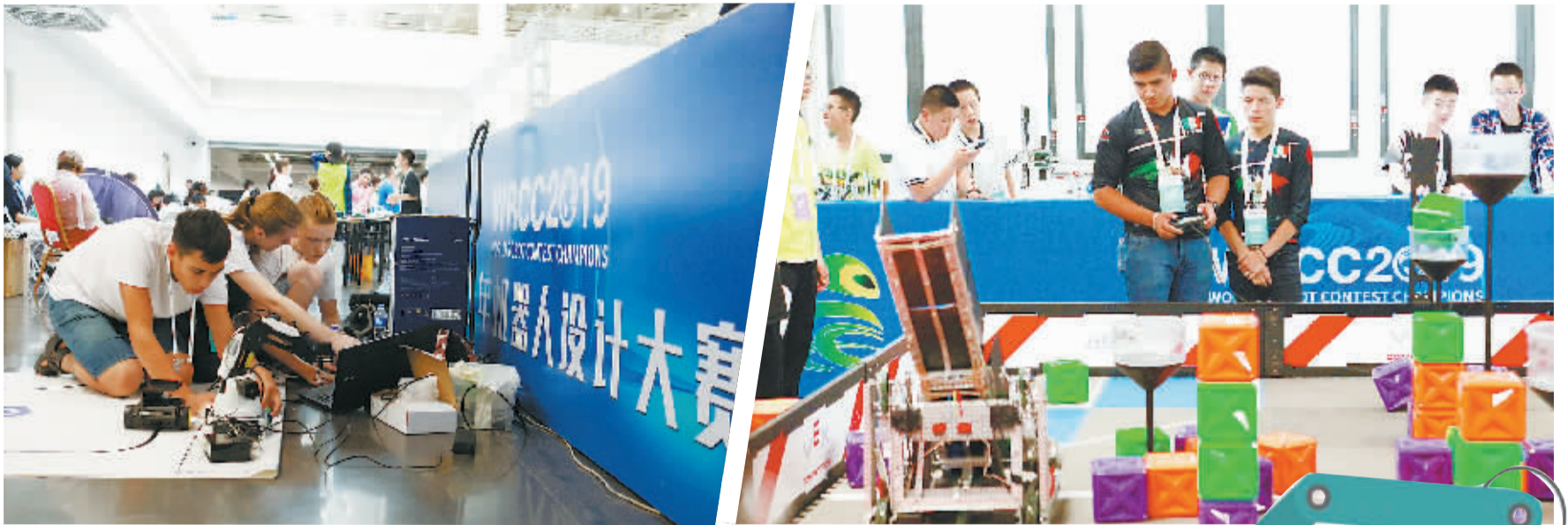
俄罗斯团队在参赛前进行校准 —— 来自墨西哥的选手正在认真地操纵手中的控制器