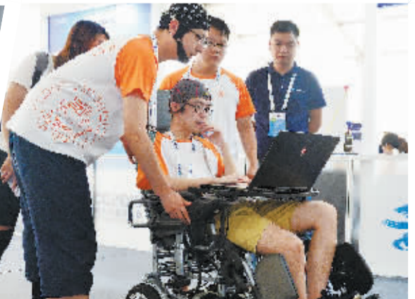
脑控大赛选手进行赛前测试