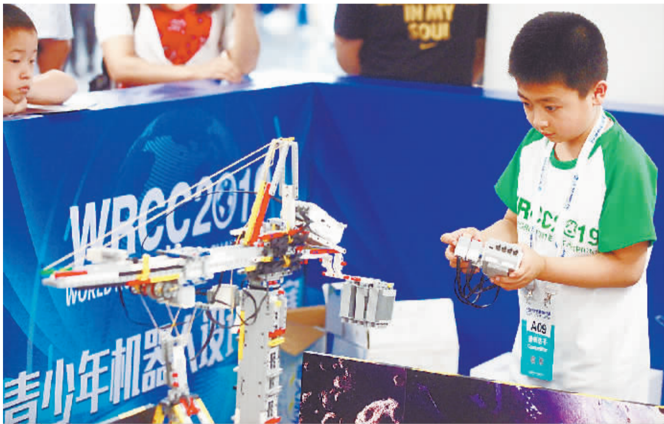
编程教育、机器人培训越来越趋于年轻化,图为小学组别的选手正在进行比赛

有着机器人界“奥林匹克”之称的“世界机器人大赛”正在火热进行中,吸引了多个国家和地区专业人士及爱好者的广泛参与。值得一提的是,大赛还专门设置了青少年机器人设计大赛,为各国热爱机器人的孩子们提供充分展示自己的平台。