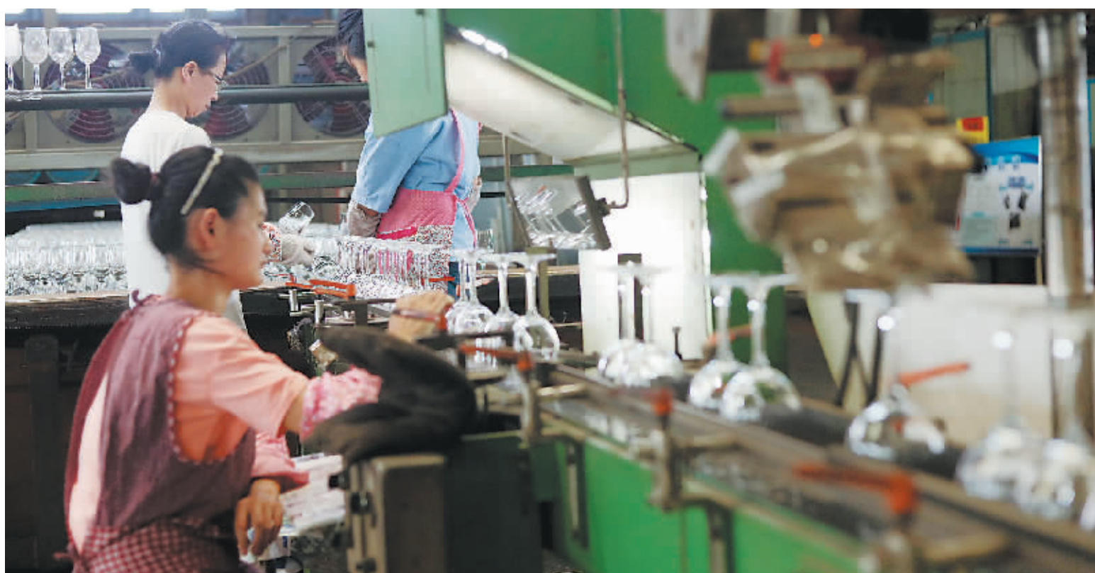
德力将专供线下高端酒店的品牌“柯瑞”进行升级，推出了专供拼多多的全定制化产品旗舰店。

义乌市苏溪徐丰工业区的瑞安赛鹏鞋业（以下简称“赛鹏”）是一家从事制鞋业30余年的老牌生产厂家，旗下有两个自有品牌赛鹏和馨而美。2012年之前，赛鹏主要是给国外（南美、北欧）大型商超、品牌等做OEM代工，每年产值3000万-5000万元。近几年来，国外订单日渐萎缩，主要精力转移电商自营。根据拼多多提供的数据显示，赛鹏入驻拼多多后，线上销售额增长9倍，利润增长3倍。