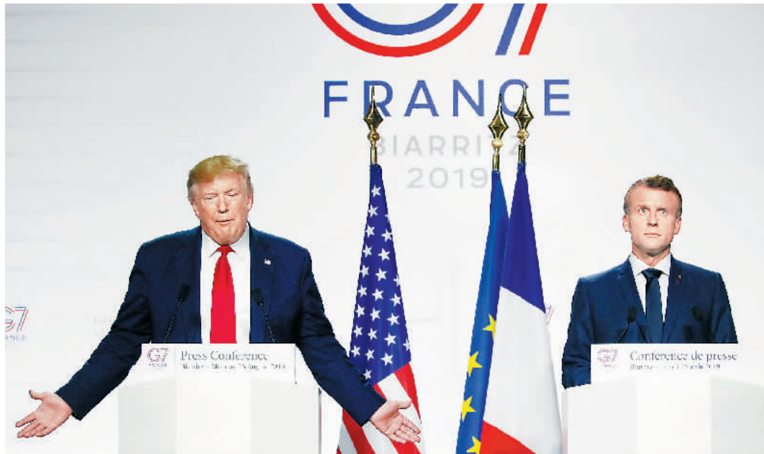
26日，G7峰会期间，法国总统马克龙和美国总统特朗普出席联合新闻发布会。