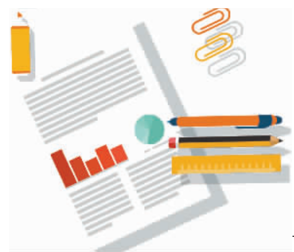
今年个税收入变化情况(单位:亿元)

今年起,新个人所得税法全面实施。作为新的制度尝试,6项专项附加扣除涉及范围广,需要大量个人自行申报,税收征管也面临着新挑战。8月28日,国家发改委、国家税务总局联合发布《关于加强个人所得税纳税信用建设的通知》(以下简称《通知》),要求全面实施个人所得税申报信用承诺制,建立健全个人所得税纳税信用记录,完善守信激励与失信惩戒机制,有效引导纳税人诚信纳税。