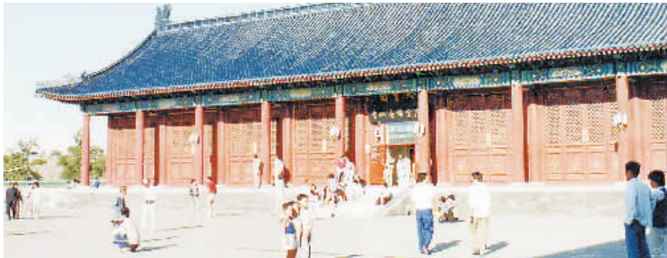
燕京书画社早期门店留影