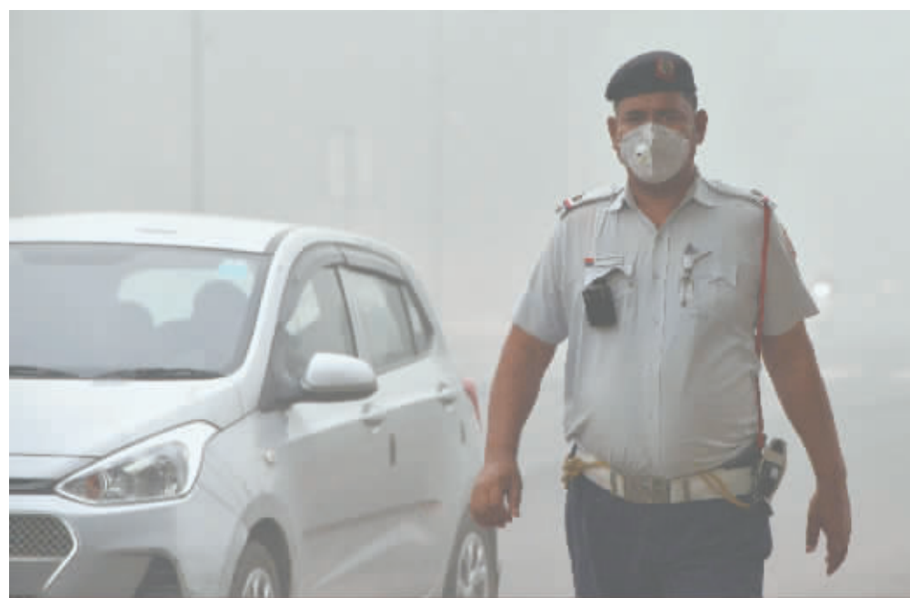
3日,在印度新德里,交警戴口罩在道路上执勤。

印度首都新德里近日遭遇严重空气污染,3日,天空雾霾依旧未散。印度空气质量预测及研究系统的数据显示,新德里1日的整体空气质量指数已达到484,为今年以来新德里空气质量最差的一天。根据指数标准,一旦指数超过400,那么当日的空气不仅会对呼吸系统患有疾病的人群产生健康风险,而且连健康人群也会受到影响。