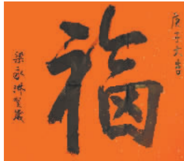
梁永琳:中国美术家协会理事 “给《北京商报》的读者拜年,向大家致以新春的祝福。”