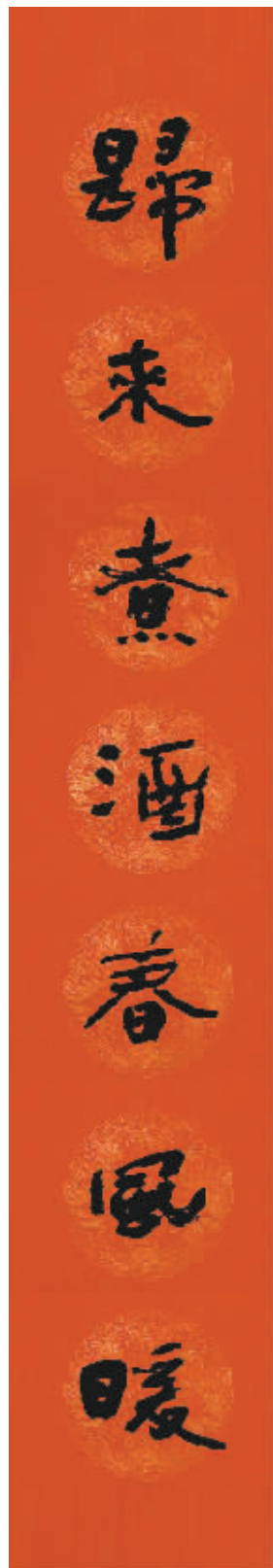
夏湘平:著名书法家 “在新春即将来临之际,向《北京商报》的读者们致以新春的祝福,祝大家新的一年大吉大利。”