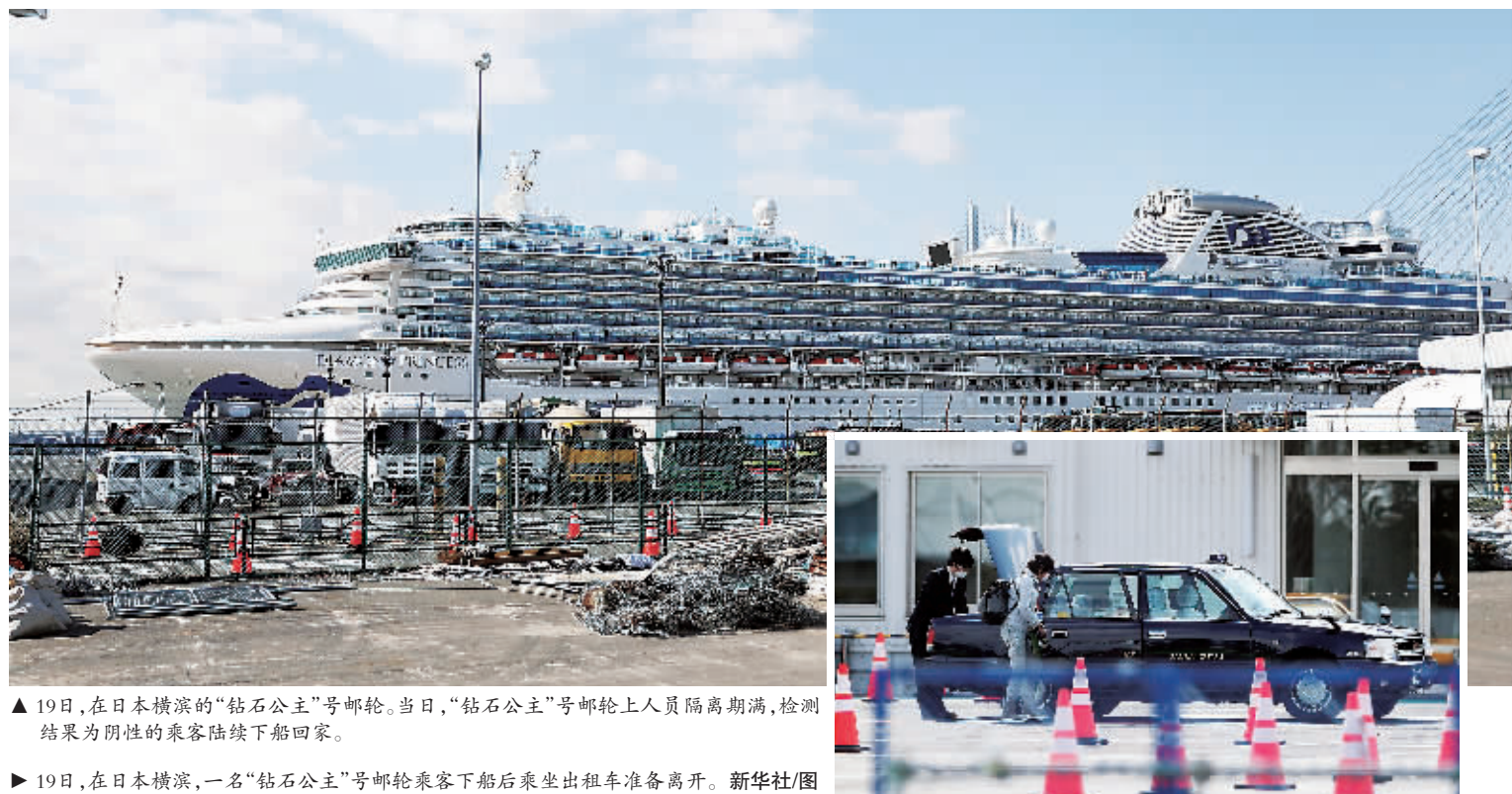
▲ 19日，在日本横滨的“钻石公主”号邮轮。当日，“钻石公主”号邮轮上人员隔离期满，检测结果为阴性的乘客陆续下船回家。