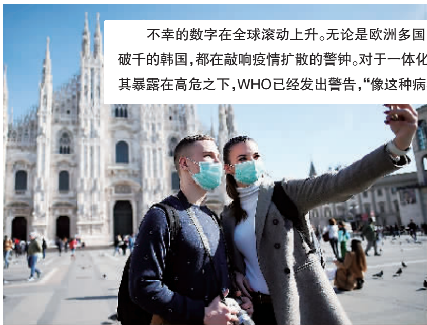
2月24日,意大利米兰,人们戴着口罩在教堂前自拍。

不幸的数字在全球滚动上升。无论是欧洲多国的从无到有,还是美国的特殊病例,抑或是几日之内病例数就破千的韩国,都在敲响疫情扩散的警钟。对于一体化的欧洲而言,意大利“沦陷”之后,四通八达的交通系统更是让其暴露在高危之下,WHO已经发出警告,“像这种病毒,几天就可以改变全局”。