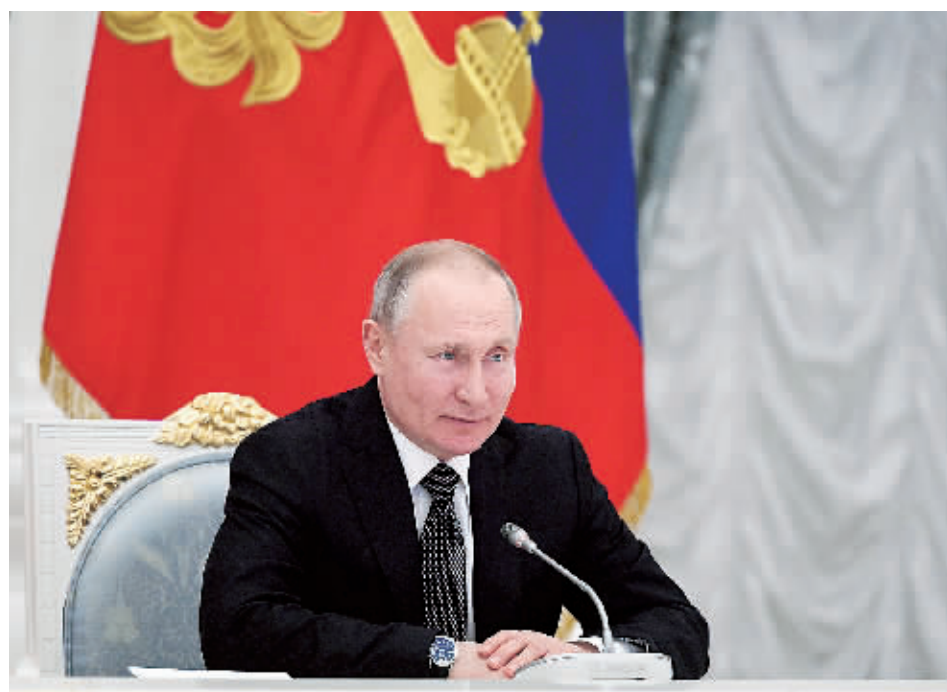
26日,俄罗斯总统普京在会见俄宪法修正案起草工作组委员时讲话。