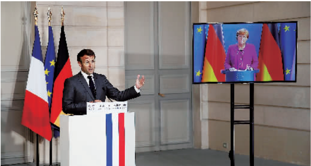
18日, 法国总统马克龙在与德国总理默克尔(屏幕中)的联合视频记者会上发言。

法国和德国领导人18日共同倡议, 欧盟设立总额高达5000亿欧元的恢复基金, 以帮助经济从新冠疫情冲击中恢复。