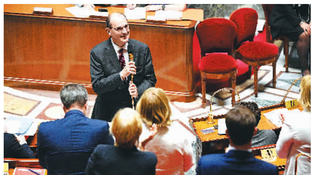
15日，法国总理让·卡斯泰(左上)在巴黎的国民议会发表演讲。

法国总理让·卡斯泰15日在国民议会发表演讲，全面阐述新政府的施政纲领。他宣布，政府将开启1000亿欧元的大规模恢复经济计划，解决受疫情影响的就业问题，并大力投资工业、环保和医疗卫生等领域。