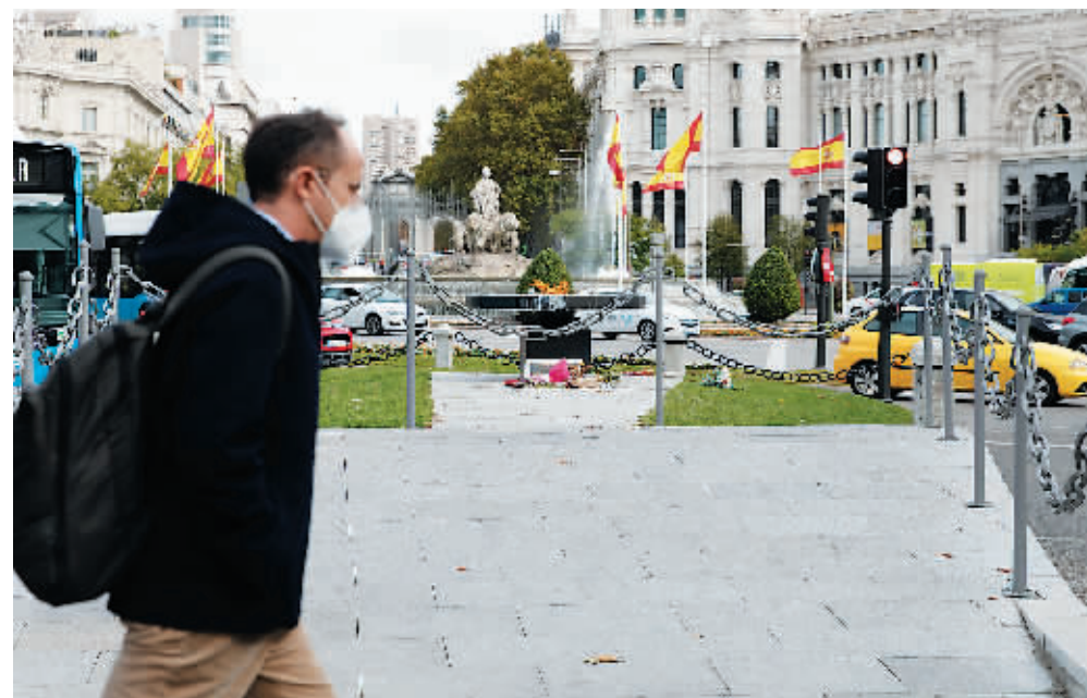
10月21日,在西班牙马德里,行人佩戴口罩经过新冠死亡纪念火炬。

西班牙成为全球第六个新冠确诊病例超百万的国家。西卫生部21日发布的数据显示,截至当地时间当日14时,全国累计确诊病例已超过百万例,死亡病例34366例。