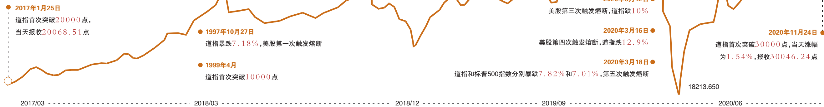
道指走势图(2017年至今)

2020年太过“玄幻”，年初见证了美股的数次熔断，年末却又见证了美股的数次冲高。如今道指一举突破30000点大关，历史再次刷新在了世人眼前。疫苗利好进展不断，美国大选终于有了尘埃落定的趋势，不确定性正在逐渐消除，资本市场提前狂欢，连带着的美国经济复苏的希望也逐步攀升，尽管眼下美国疫情依旧肆虐，新的经济刺激措施也依旧“难产”。