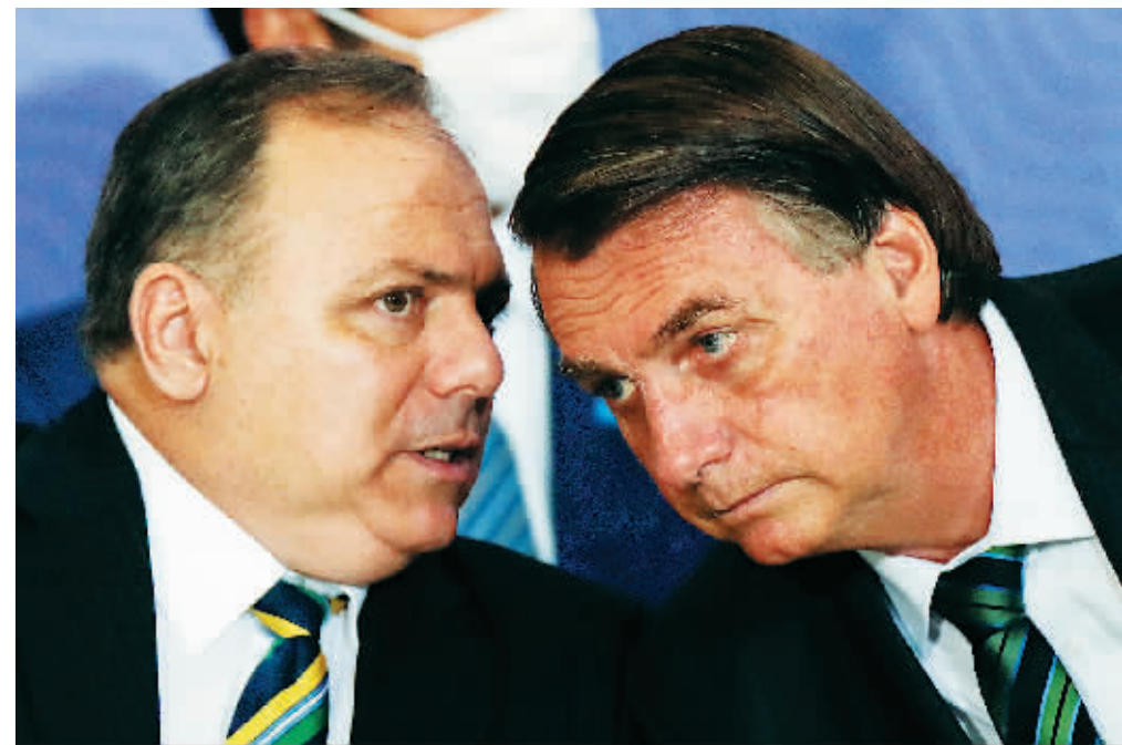
16日,巴西卫生部长爱德华多·帕祖洛(左)与巴西总统博索纳罗在新冠疫苗接种计划出台仪式上交谈。

巴西卫生部16日发布的新冠疫情数据显示,该国累计确诊病例已超过700万例,成为继美国和印度之后第三个确诊病例超700万的国家。