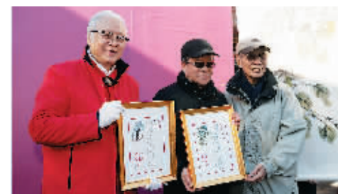
获颁荣宝斋收藏证书