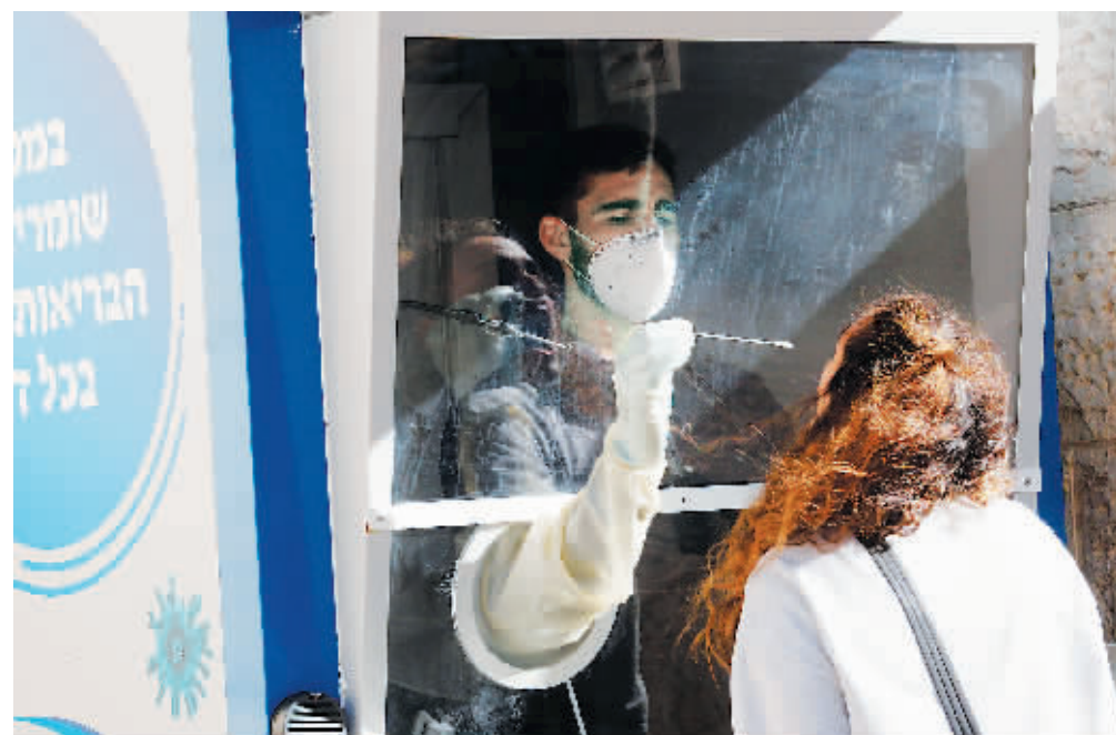
27日，在以色列中部城市莫迪因，一名医务人员进行新冠病毒检测采样。

为遏制新冠疫情蔓延，当地时间27日起，以色列将开启第三次全国性封锁。除就医、锻炼等特殊情况下，以色列大多数民众的活动范围将被限制在住所附近1公里以内。与此同时，以色列总理内塔尼亚胡表示，大规模的疫苗接种，将在几周内帮助该国重建一定程度的正常。