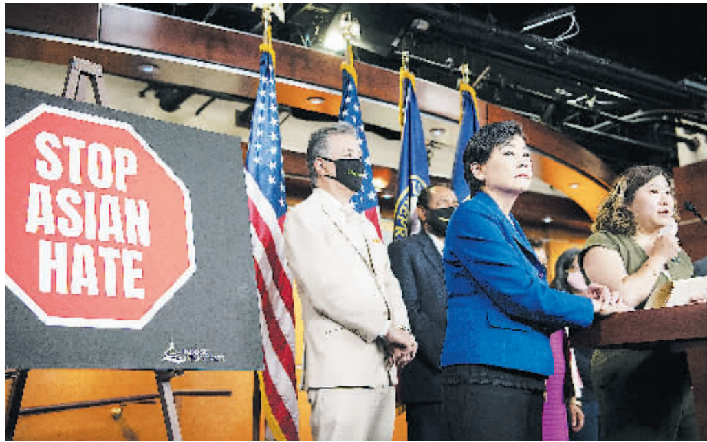
18日,美国华盛顿特区,众议院议员们出席新闻发布会。

美国国会众议院18日以压倒性优势通过一项打击新冠疫情下反亚裔仇恨犯罪的法案,并将其递交白宫。