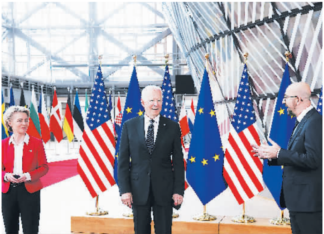
15日,比利时首都布鲁塞尔,美欧峰会举行。欧盟委员会主席冯德莱恩、美国总统拜登、欧洲理事会主席夏尔·米歇尔出席会议。