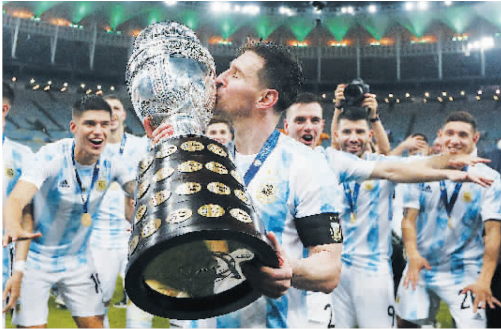
10日，巴西，2021美洲杯决赛，巴西0-1阿根廷。CFP图

2021美洲杯足球赛决赛10日晚在里约热内卢马拉卡纳大球场举行，阿根廷队凭借上半场迪玛利亚的进球1:0战胜东道主巴西队，获得冠军。这是阿根廷球星梅西代表国家队捧起的首个成年国际大赛冠军。