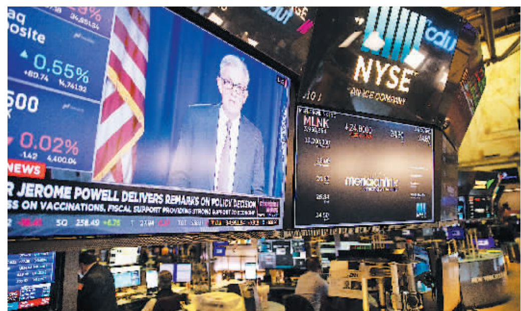
28日,美国纽约证券交易所,美联储表示将继续维持超低利率。

美国联邦储备委员会28日宣布维持联邦基金利率目标区间在零至0.25%之间,符合市场预期。