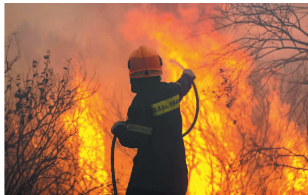
3日,消防员在希腊雅典北部郊区进行灭火作业。

希腊首都雅典北部山林地区3日下午发生山火,附近数千居民撤离。火灾已造成至少6人因呼吸问题入院治疗,另有一名消防员受伤,部分房屋损毁。