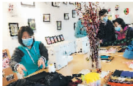
花委汇成员们聚集在社工活动中心交流

◆2021年 北京全年新确认老旧小区改造项目427个,东城区23个 确保新开工老旧小区综合整治313个,东城区20个 完工124个,东城区8个