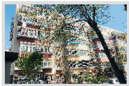
翻修一新的老旧小区楼体,环境也改善了不少

退去了街角巷弄的生活气息,即便是被改造过后的商业楼宇,也将设计效果发挥到极致。中粮·置地广场位于东城区安定门外大街208号,总建筑面积81698平方米,原址为三利大厦和三利百货。在腾退了原有的200余家商户、淘汰了零售批发业态后,这座建筑也被升级为国际智能化的5A写字楼。