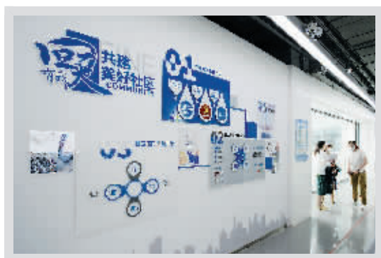
回天地区公共服务配套设施不断补齐

2021年是回天地区公共服务和基础设施优化提升两轮行动计划的衔接之年，昌平区共安排教育、交通、市政、社会管理等领域75项重点项目。截至目前已开工慢行系统二期等13项，完工天南街道综合服务中心、天北街道综合服务中心2项，投用回天地区绿地微提升、天北街道派出所2项。预计到年底可再完工9个、投用31项，增加幼儿园学位1620个、医疗及养老床位1200张、人才保障房2306套及配套停车位2616个。