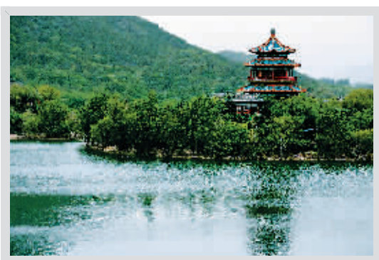
昌平区今年新增及提升造林1.4万亩