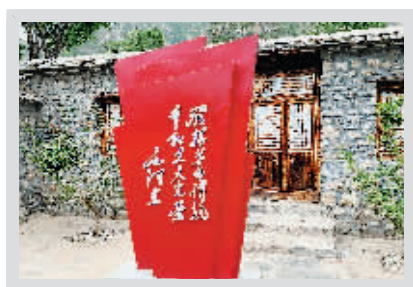
十渡镇马安村党史馆院内立牌

走进位于堂上村的没有共产党就没有新中国纪念馆《前言》部分介绍了这首歌的创作背景:1943年10月,年仅19岁的群众剧社小分队队员曹火星,在今房山(原房涞涿联