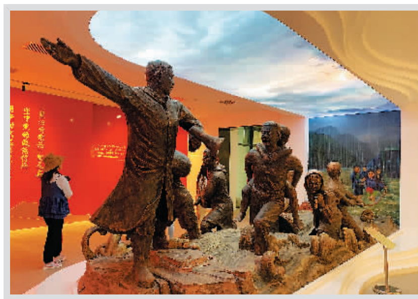
周口店镇红色背篓精神纪念馆内雕塑

近年来,房山区为了打造红色旅游胜地也做了相应的改造和提升。2005年,平西抗日战争纪念馆