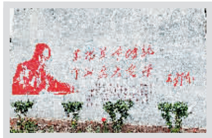
十渡镇马安村红色旅游景点